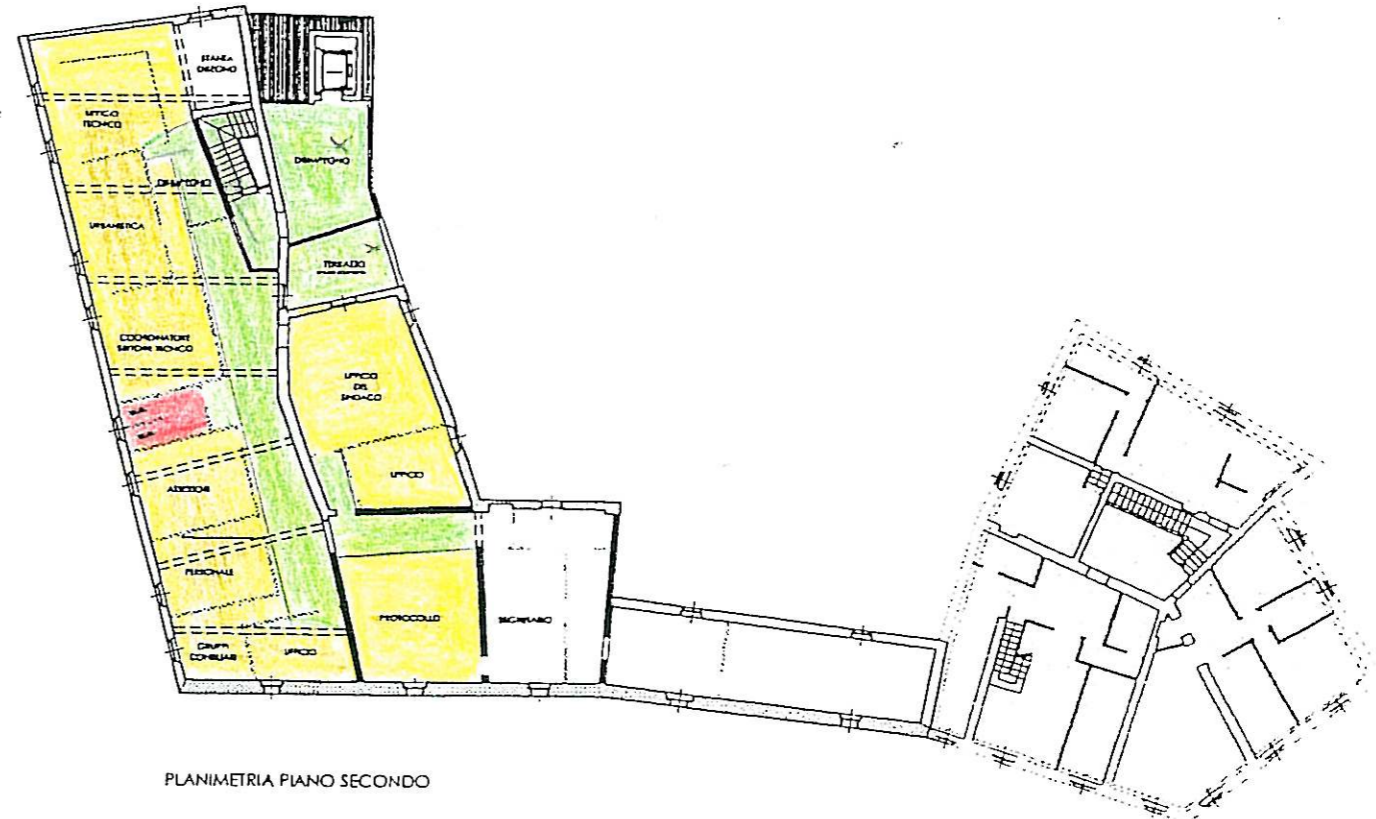
PLANIMETRIA PIANO SECONDO