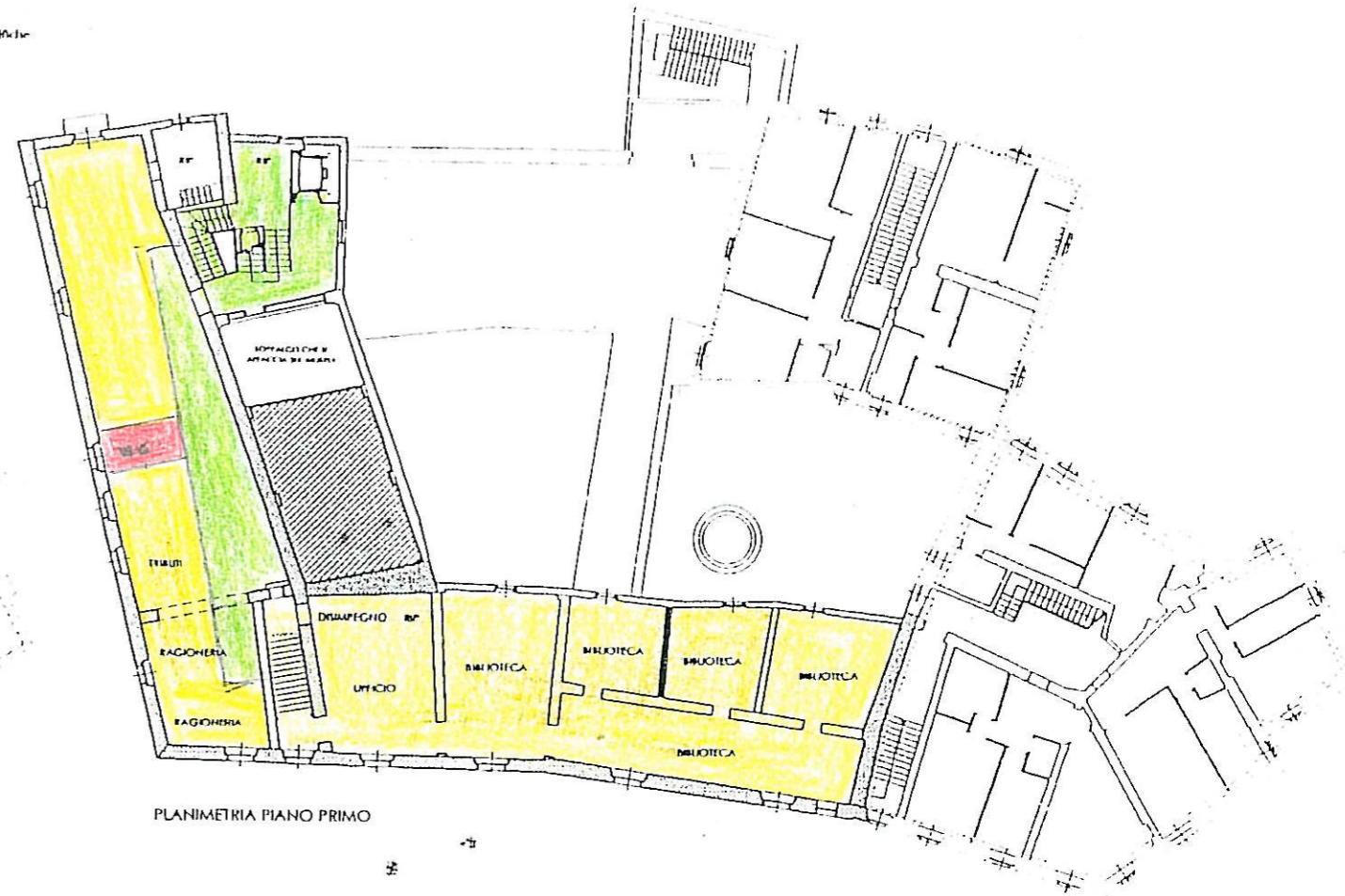
PLANIMETRIA PIANO PRIMO

□ Porzione di edificio non soggetta a verifica