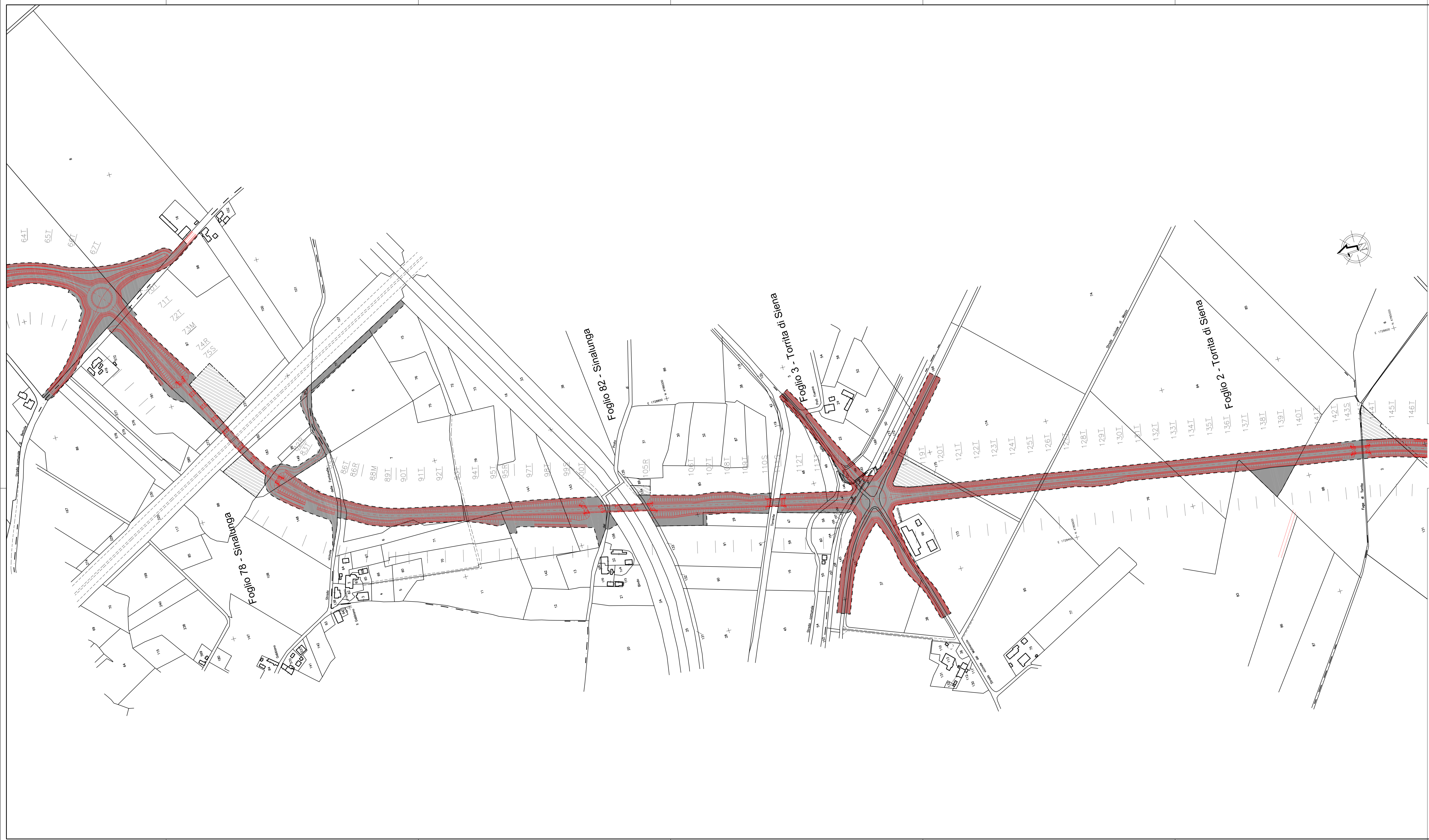
QUADRO D'UNIONE PLANIMETRICO