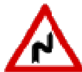
Fig. II 6