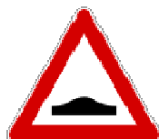
Fig. II 2