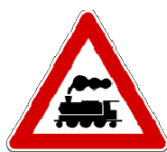
Fig. II 9