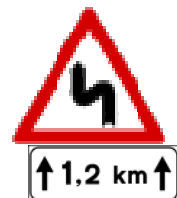
Fig. II 7 + Mod. II 2