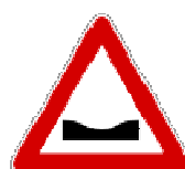
Fig. II 3