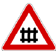
Fig. II 8