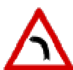
Fig. II 5