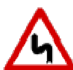
Fig. II 7