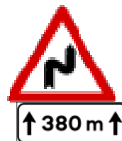
Fig. II 6 + Mod. II 2