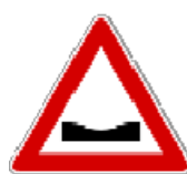
Fig. II 3