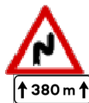
Fig. II 6 + Mod. II 2