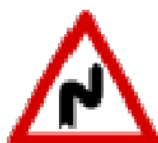
Fig. II 6