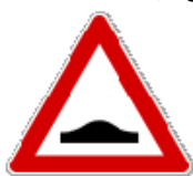
Fig. II 2