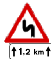
Fig. II 7 + Mod. II 2