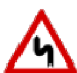
Fig. II 7