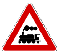
Fig. II 9