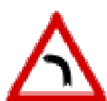
Fig. II 5