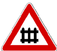
Fig. II 8