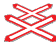
Fig. II 10/b – 10/d