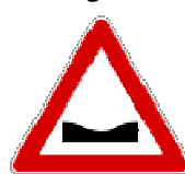
Fig. II 3