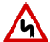
Fig. II 7 + Mod. II 2