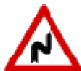
Fig. II 6